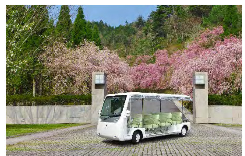
イルカカレッジで開発した電気自動車