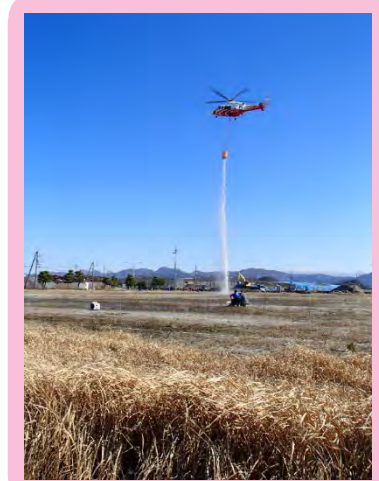
「航空消火システム」高高度からの確に消火